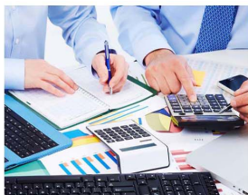
SALES & MARKETING