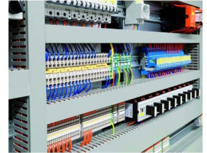
ELECTRICAL & INSTRUMENTATION