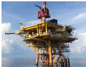
OIL & GAS