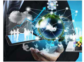
IT & TELECOM