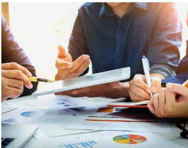
ACCOUNTS & FINANCE